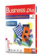
สุดยอดโปรแกรมเงินเดือนสำเร็จรูป Business plus Payroll