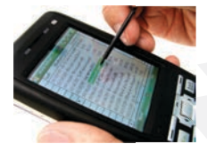
สุดยอดโปรแกรมหน่วยรถ Business plus Van Sales

Business Plus ได้รับการพัฒนาอย่างต่อเนื่องและทันสมัยตามเทคโนโลยี สมบูรณ์แบบที่สุด ถูกต้องตามกฎหมายกรมสรรพากร สะดวก รวดเร็ว ถูกต้องและแม่นยำ มีความยืดหยุ่นในการทำงานสูง มีผู้เชี่ยวชาญในการวิเคราะห์/จัดวางระบบ ทีมงานขายและบริการส่วนกลางที่มีความรู้และความสามารถ มีทีมงานติดตั้ง อบรมการใช้งานอย่างแท้จริงที่บริษัท มีศูนย์บริการและฝึกอบรมลูกค้าอย่างต่อเนื่อง ทันสมัย มีตัวแทนจำหน่ายแต่ละเขต ทั่วประเทศ ที่มั่นคงและมีคุณภาพจนถึงปัจจุบัน ได้รับความไว้วางใจจากลูกค้าทั่วประเทศมากกว่า 10,000 บริษัททั่วประเทศ เน้นลูกค้าซื้อไปใช้งานแล้วประสบผลสำเร็จมากที่สุดเหมาะกับองค์กรและผู้บริหารที่มองการณ์ไกล