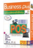
สุดยอดโปรแกรมบริหารงาน ค้าปลีก-ค้าส่ง สำเร็จรูป Business plus POS